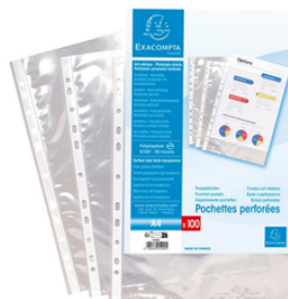
1 paquet de Pochettes perforées 100 feuilles