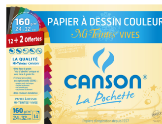
1 pochette de Canson couleurs vives 24x32 160g