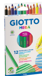
1 boîte de 12 gros crayons de couleurs