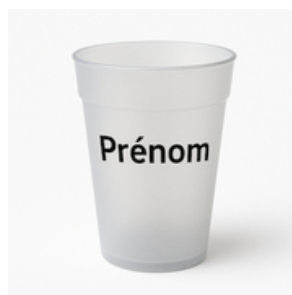
1 gobelet en plastique dur au nom de l'enfant