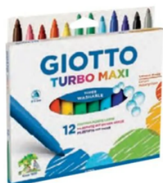
1 boîte de 12 gros feutres de couleurs