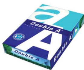
1 ramette A4 80g Feuilles blanches