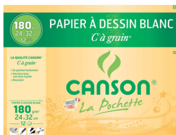
1 pochette de Canson blanc 24x32 180g