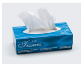
2 boîtes de 150 mouchoirs en papier