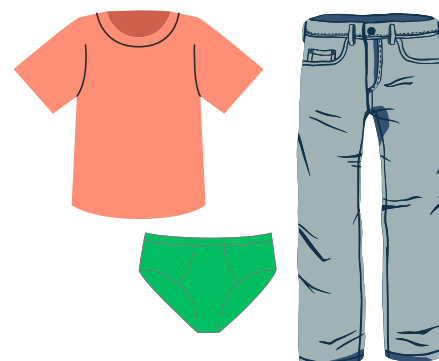
Prévoir un change complet dans un sachet avec le nom de l'enfant (sous vêtement – bas et haut)