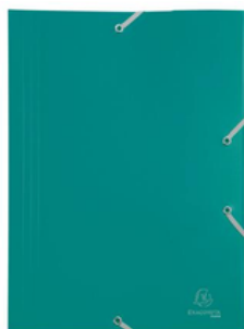
1 chemise 3 rabats à élastiques A4 verte