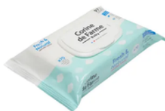
1 paquet de lingettes